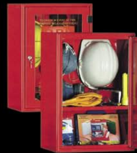
Dispositivi di Protezione Individuale