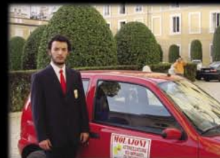
Galleria Palazzo Colonna